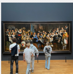
Excursies, uitstapjes & bedrijfsbezoeken