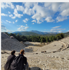
Reizen & uitwisseling