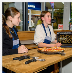
Stages & opdrachten in de praktijk