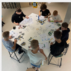
Talentuur, Lego League & Atelier Varendonck